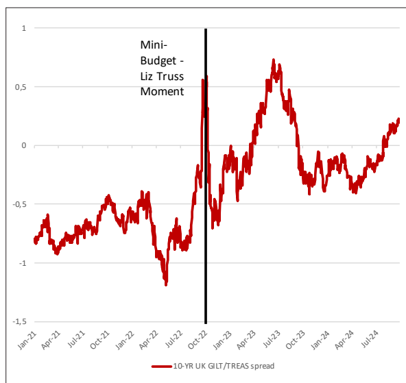
G1: 10YR UK GILT / US TREASURIES SPREAD

Septembre est aussi un mois anniversaire: Il y a deux ans Liz Truss succédait à Boris Johnson comme premier ministre. Restée en fonction 49 jours seulement, son nom est pourtant fameux aujourd'hui tant en Angleterre qu'à l'international. Pour son malheur il est souvent accolé au mot « moment ». Un « Liz Truss moment » désigne un décrochage très brutal des marchés dû à une erreur de politique économique. En septembre 2022 l'annonce de baisses